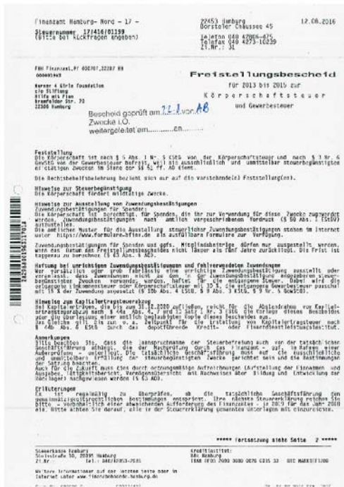
Freistellungsbescheid der W4G