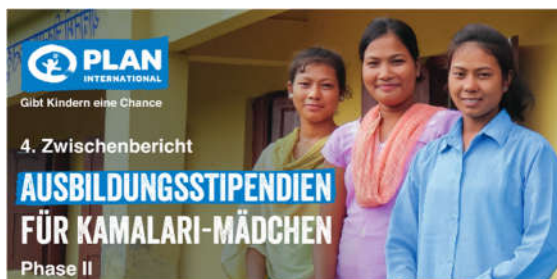
Neues aus dem Kamalari-Projekt