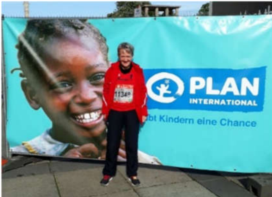
Marita beim 25-km-Lauf in Berlin