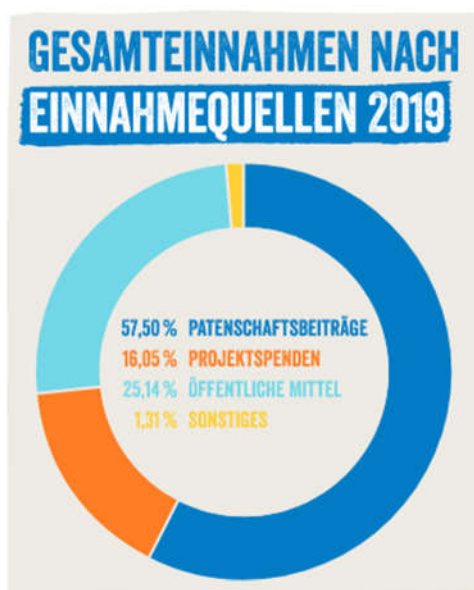
Übersicht aus dem Plan Jahresbericht