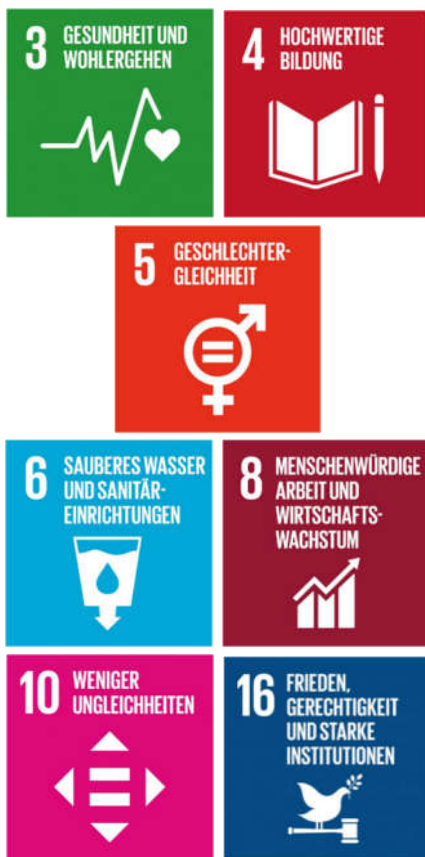
Die 7 Fokusziele von Plan