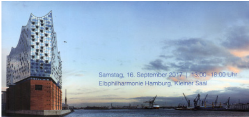
Einladung zum Stiftertreffen in Hamburg