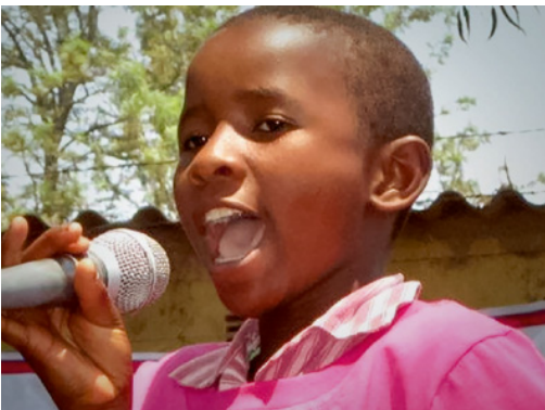
Stipendiatin im 18+ Projekt