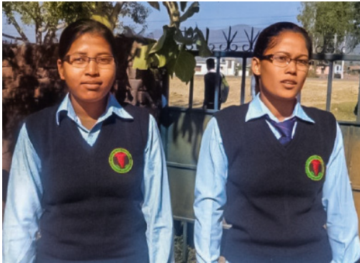
Stipendiatinnen, Kamalari Projekt