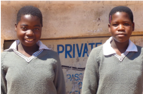
Stipendiatinnen im 18+ Projekt