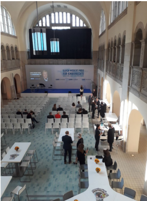
Die Wickert-Preise und der Peter-Scholl-Latour-Preis wurden im renovierten Stadtbad in der Oderberger Straße in Berlin verliehen, also quasi „auf dem Wasser“ - Das Bad füllt sich gerade.