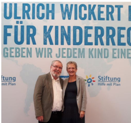
Außerdem waren wir im September bei der Verleihung der Ulrich-Wickert-Preise für Kinderrechte in Berlin.