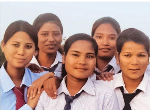
Stipendiatinnen, Kamalari Projekt