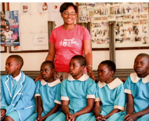
Stipendiatinnen im 18+ Projekt