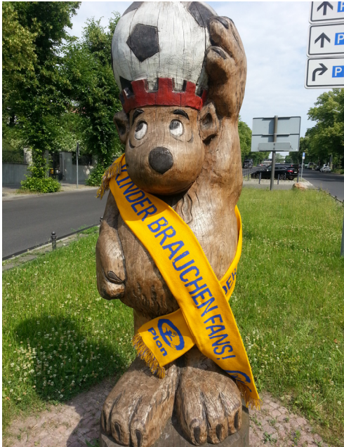
Die PLAN-Kampagne mit den deutschen Sportverbänden läuft auf vollen Touren: Auch der Berliner Bär vor dem Südeingang des Berliner Olympia-Stadions wirbt für „Kinder brauchen Fans“