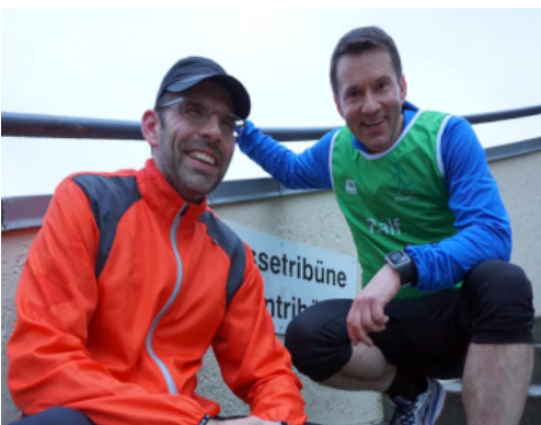
Die beiden (übrigens sehr guten) Läufer sind nicht die einzigen der Laufgruppe, die Warner 4 Girls unterstützen.