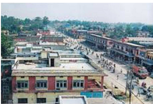
Phulmatis Heimatstadt

„I have bitter experiences while working there. It was so hard to me to work there as I was too small. I had to wash clothes, clean room including toilet and bathroom, cook food, take care of children and also farm related work. I got punished for being unable to complete work on time as ordered by masters.“ (Phulmati)