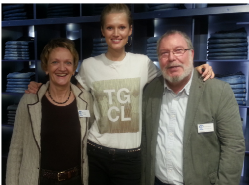
Marita, Toni Garrn und André in Berlin

TONI GARRN FOR CLOSED HELPING CHILDREN IN BURKINA FASO WITH PLAN INTERNATIONAL