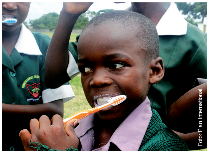
Mit Plan International lernen Kinder auf ihre Gesundheit zu achten.