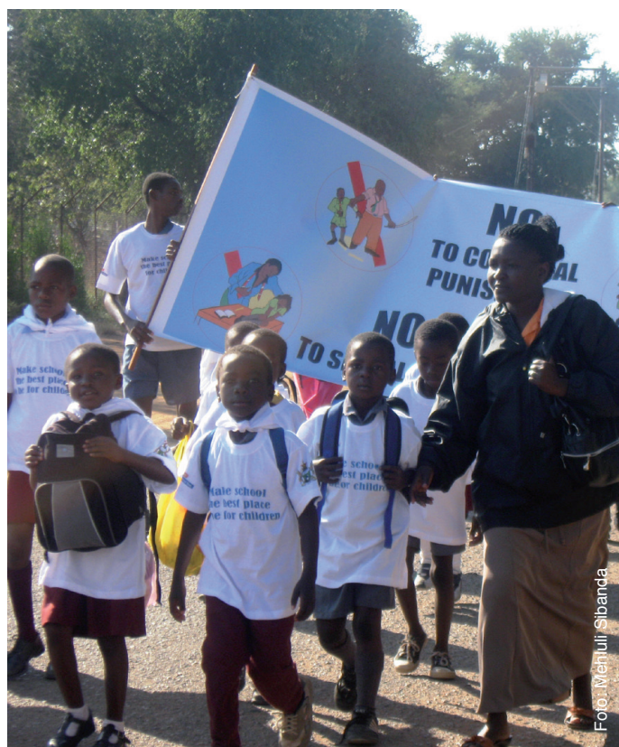
Plan International ermutigt die Kinder sich für ihre Rechte stark zu machen.

Wir stärken die Familien, indem wir ihnen Mittel an die Hand geben, die ihre (land-) wirtschaftliche Produktivität steigern, so dass sie in der Lage sind, ihre Nahrungssituation zu verbessern. Beispielsweise erhalten Familien Saatgut oder lernen neue Bewässerungsmethoden kennen. Gemeindeglieder organisieren sich in Spar- und Kreditgruppen und können so finanzielle Ressourcen aufbauen sowie Investitionen tätigen. Wir helfen den Familien dabei, landwirtschaftliche Produkte besser am Markt anbieten zu können. Zudem fördern wir die Vernetzung der Kleinbauern mit überregionalen landwirtschaftlichen Interessengemeinschaften. Ergänzend dazu unterstützen wir Schulspeisungsprogramme, um die Ernährungssituation der Kinder zu verbessern. Um gezielt die Jugendlichen zu stärken, vermitteln wir technische Fertigkeiten und entwickeln gemeinsam Ideen, wie sie, meist über kleine Gewerbe oder landwirtschaftliche Aktivitäten, ein eigenes Einkommen generieren können.